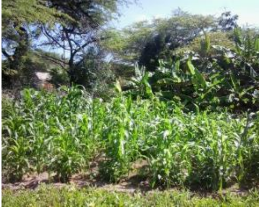
Conuco en Miraca. 17/01/2014

de recolección. Entre el equinoccio de otoño y el solsticio de invierno, (mes de octubre), es entonces el tiempo de las primeras lluvias, y lunas propicias para la siembra del maíz.