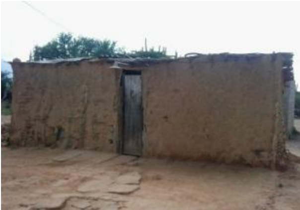
Vivienda de barro en Baruní, Península de Paraguaná. 21/11/2013

Durante siglos, la vivienda ha sido una práctica comunitaria. Esto es un hecho común a todos los pueblos del mundo, siempre es la comunidad la que de una forma u otra construye sus viviendas. Existen en los más variados estilos y formas. La mayoría de las veces haciendo uso de los materiales y recursos que se encuentran en el mismo lugar de habitación y que proporciona la Madre Naturaleza. En las montañas bolivianas, por ejemplo, cuando una joven pareja se une, toda la comunidad se avoca a construirles su nueva casa. Es una fiesta para todos en la cual, los hombres construyen la vivienda y las mujeres apoyan con la preparación de los alimentos, hasta que los nuevos esposos entran a vivir ahí. Un hermoso ejemplo de lo que estamos contando.