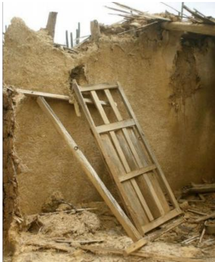
Casa de Barro en ruinas. Abudure. 27/03/2012.

Observemos entonces, la diferencia entre una práctica cultural colectiva en la que todas las personas saben, pueden y cuentan con los materiales para hacer ellos mismos su vivienda, y otra, importada, en la que lo que acontece es una absoluta dependencia de los sectores mercantiles, ahora dueños de la producción de materiales necesarios para satisfacer, no la necesidad de vivienda, sino una estética determinada, muy específica y promovida desde modos de vida impuestos por la cultura hegemónica.